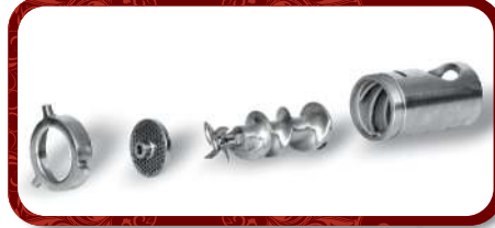
Removable Head Unit