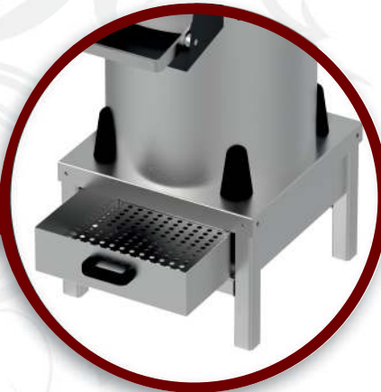
Filtre | Filter