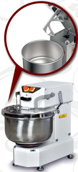
BSH.20 Kalkar Kafa